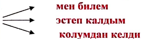
Схема боюнча айтып бергиле:

- Бүгүнкү сабак канчалык кызыктуу жана пайдалуу болгондугун баалаңыз.